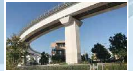
一般の電車では半径160mは必要です。