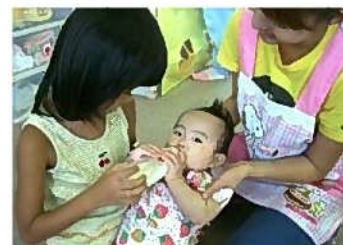
赤ちゃんとのふれあい体験

県としては、必要に応じて、これまでの3年間の取組を踏まえた情報提供などの支援を行っていく。