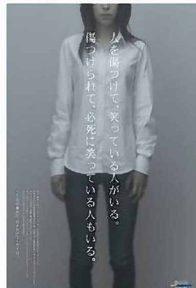
20 年度人権週間ポスター (人権啓発資料法務大臣表彰優秀賞（ポスター部門）受賞)

偏見や差別のない愛知の実現を目指して、フェスティバルの継続した開催、マスコミや広く県民の目に触れる媒体を活用した効果的な啓発に努めていく必要がある。