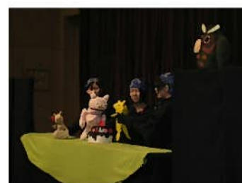
命をみつめる地域のつどい

親が「命の大切さ」を自覚し、いじめや虐待をなくして、生きることのすばらしさを学ぶ機会を意識的に設けていくことが必要である。