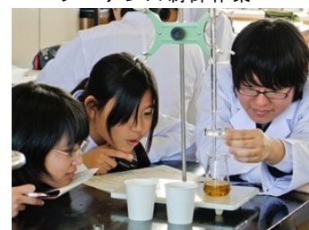
校内ゼミ（科学実験）