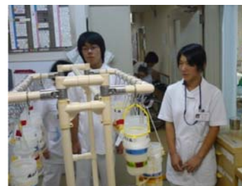
病院でのインターンシップ

今後も地域や産業界等の人々の協力を得ながら、就業体験の機会を積極的に設ける必要がある。