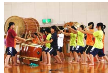
部活動（和太鼓）の様子