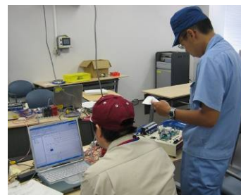
シーケンス制御作業

文化活動では4校を運動部活動では6校を指定し、それぞれの学校において特徴を生かして、全国レベルの大会で一定の成果をあげた。