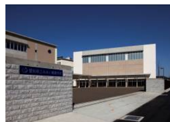
愛知県立みあい養護学校

また、県立知的障害養護学校の過大化に伴う問題を整理するとともに、知的養護学校の将来構想を作成し、喫緊の課題である一宮東養護学校の過大化解消を図るために、元平和高等学校の具体的な活用について、調査・検討し、新設養護学校の基本設計を行った。