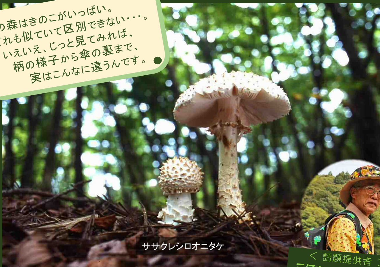
ササクレシロオニタケ

秋の森はきのこがいっぱい。 どれも似ていて区別できない……。 いえいえ、じっと見てみれば、 柄の様子から傘の裏まで、 実はこんなに違うんです。