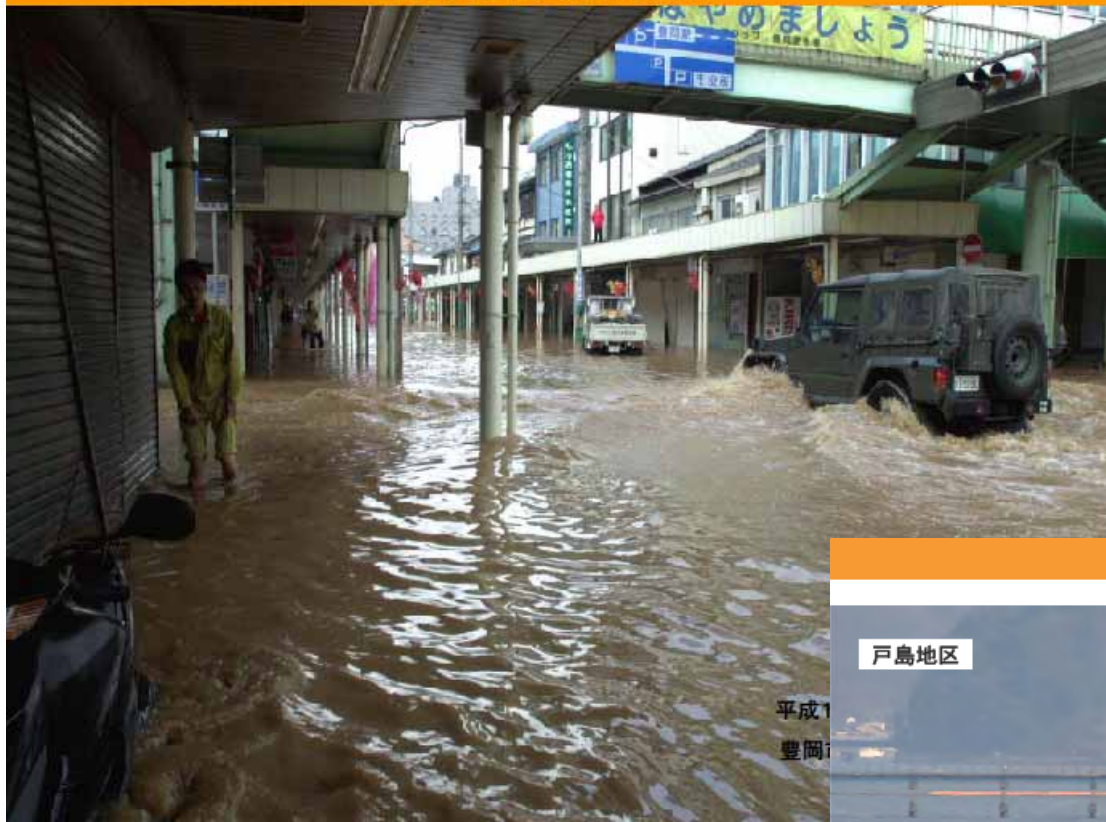
平成16年台風23号による被害