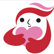
犯罪被害者等支援 シンボルマーク 「ギョットちゃん」

侵害の回復を図るには、一人ひとりが犯罪被害者等の声に耳を傾け、考えることが大切です。