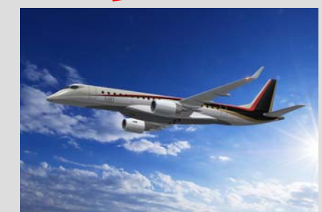
MRJ完成予想図