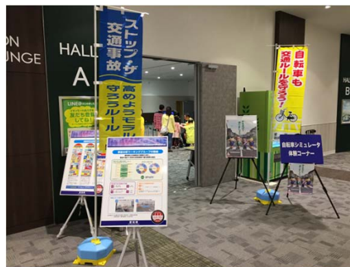
イオンモール長久手での啓発活動