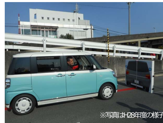
※写真はお28年度の様子