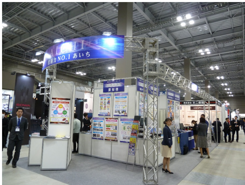
写真は昨年度同事業（AUTOMOTIVE WORLD 2017）の様子

「AUTOMOTIVE WORLD」：自動車の電子化・電動化、IT化、軽量化、部品加工などをテーマとした6つの展示会で構成され、自動車業界における重要テーマの最新技術が一堂に集結するアジア最大級の自動車の先端技術展。