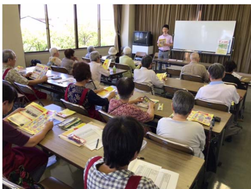
下萱津コミュニティ防災センターでの高齢者講習会