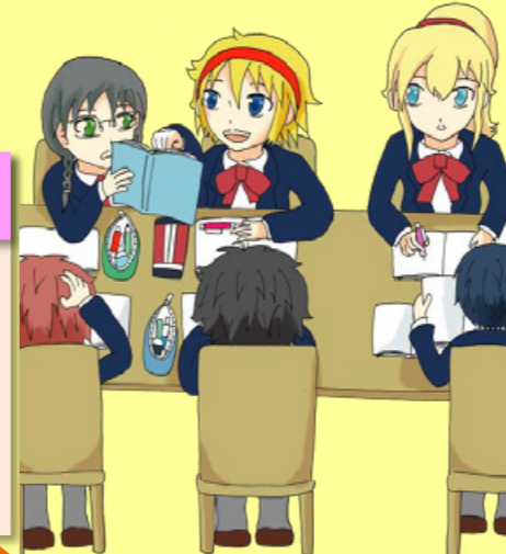
若者・外国人未来塾