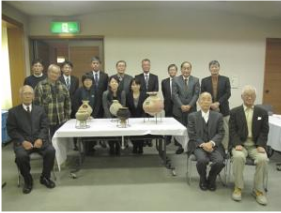
談話会「教育と文化」のみなさん

当センターでは、グループでの見学を受け付けています。希望されるグループの代表の方は事前に下記の連絡先に連絡を入れてください。