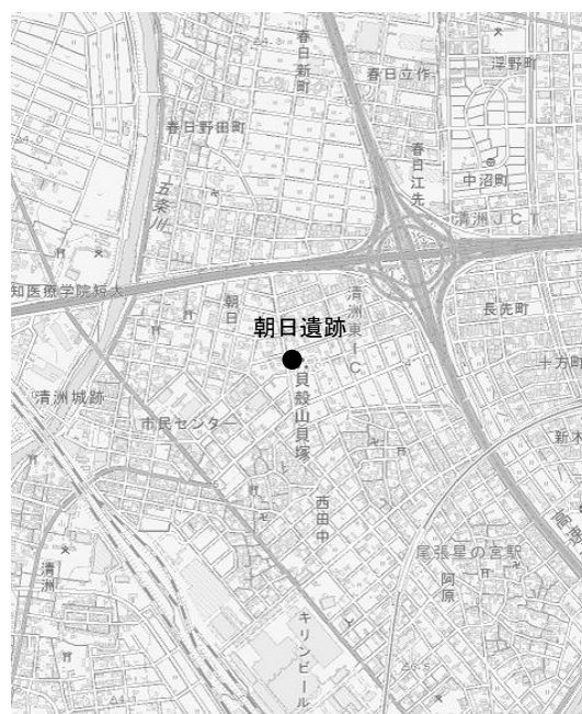
国土地理院 1/2.5万 地形図「清須」