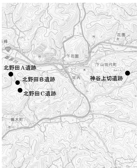
国土地理院 1/2.5万 地形図「東大沼」