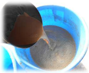
液状ビール酵母の写真

体重が約80~115kgである34日間、豚6頭ずつに、それぞれの飼料を給与しました。