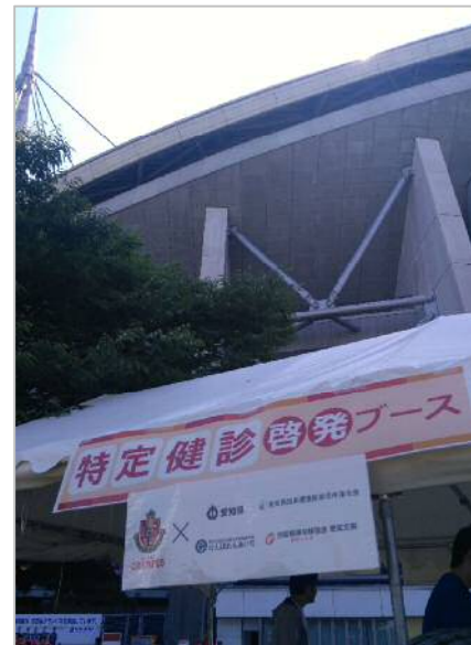
豊田スタジアム前の広場で、名古屋グランパスの試合前にキャンペーンを実施しました。