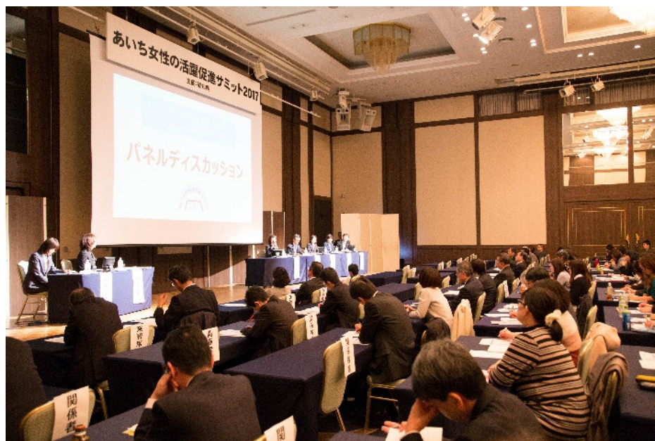
あいち女性の活躍促進サミット 2017 (メルパルク名古屋：11月27日)

あいち女性の活躍促進会議の構成団体と連携し、企業トップの更なる意識改革を図るためのサミットを開催した。また、サミットの中で、「あいち女性輝きカンパニー」優良企業表彰式を実施した。