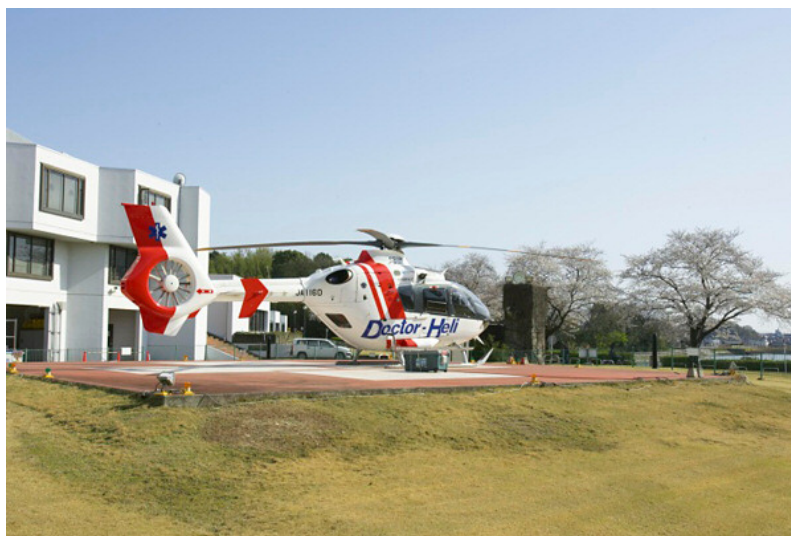
愛知県ドクターヘリ