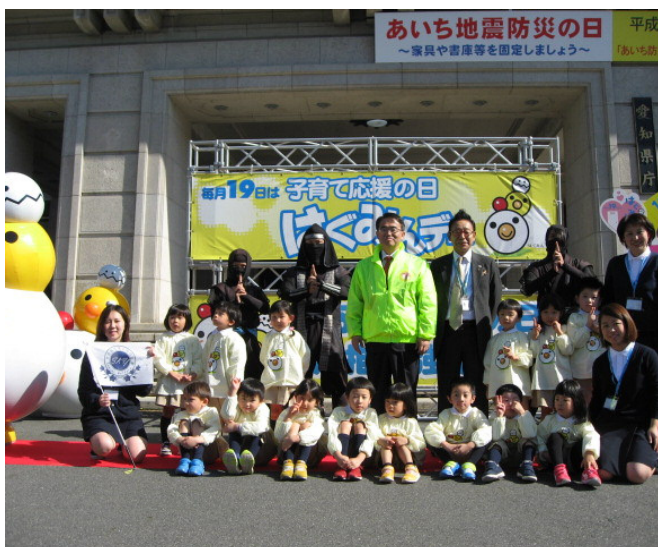
「子育て応援の日（はぐみんデー） 普及推進強化月間スタート式」