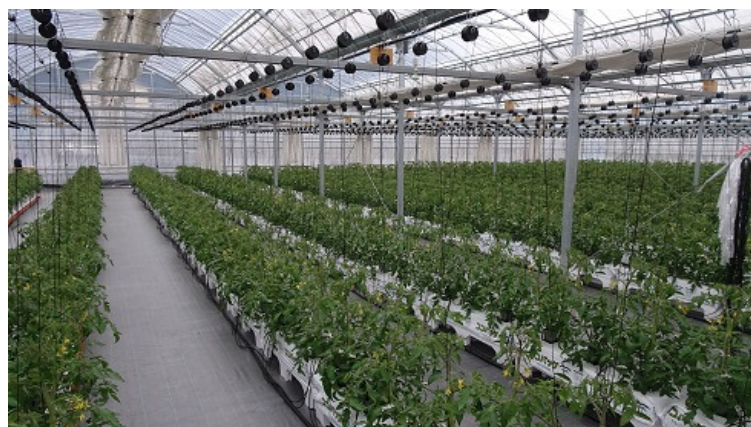
設楽町で導入したトマト栽培施設