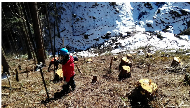
林業技術者の育成研修（獣害対策用ネット設置）