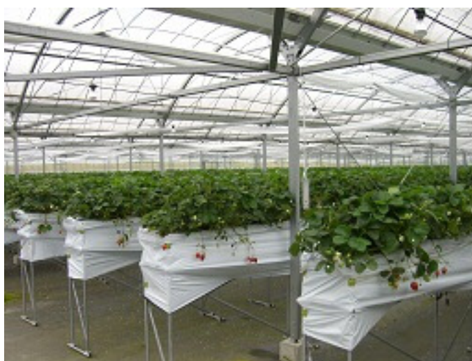
新城市で導入したイチゴ栽培施設