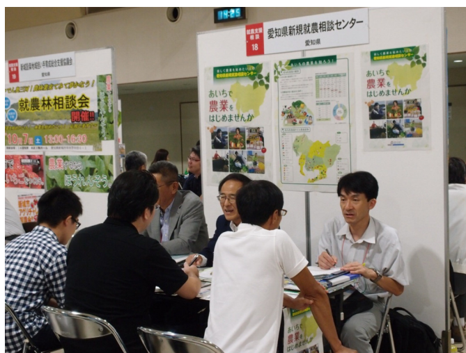
新・農業人フェア名古屋会場（9月16日：名古屋市中小企業振興会館）