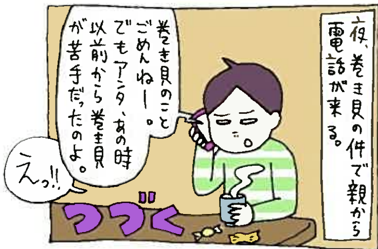
【57日目】貝殻マニアの世界