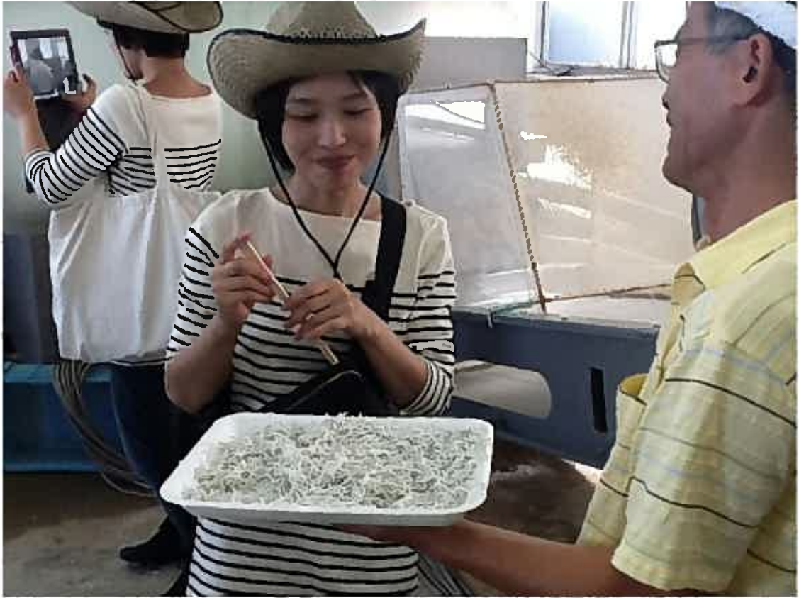
出来たてのしらすを食べているところ。