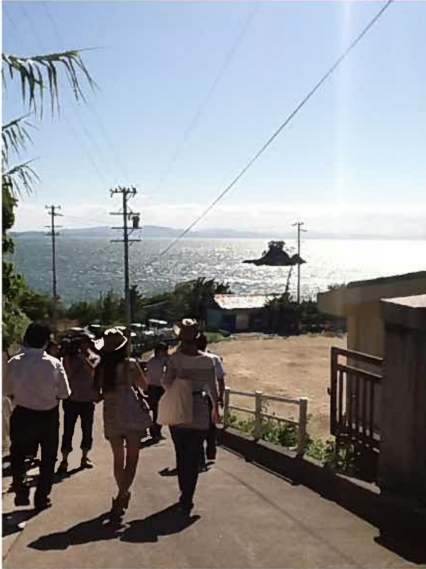
松島の展望台への道。