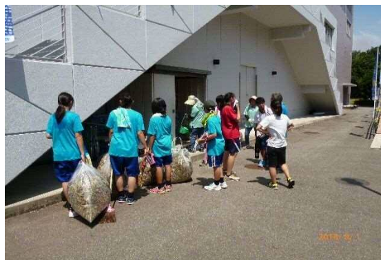
会場の清掃の様子（西尾市）