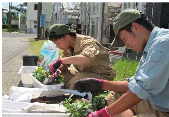
会場地装飾用の草花栽培の様子 （新城高）