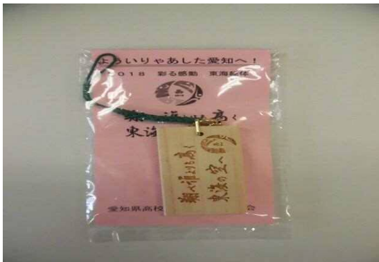
参加選手への手作り記念品