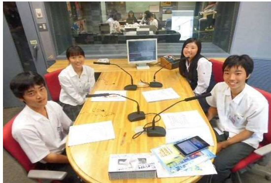
高校生ラジオ収録(6/16)