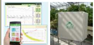
環境モニタリング機器