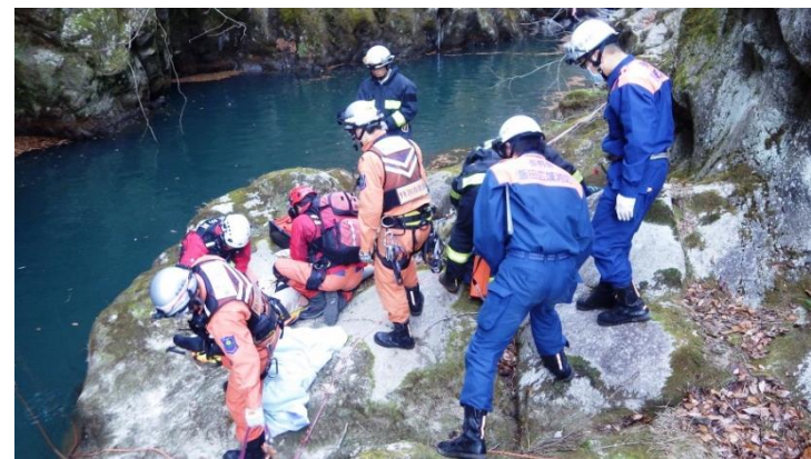
広域航空消防応援活動