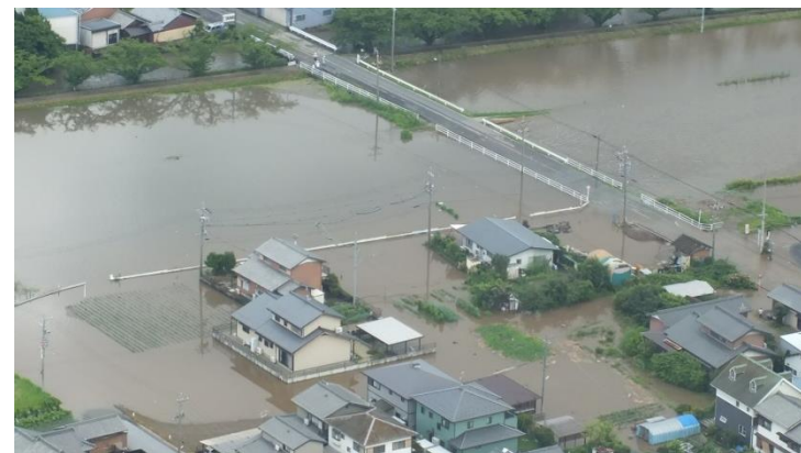
災害応急対策活動