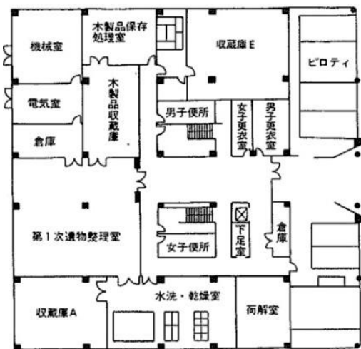
1 階 1,124.45 m 2