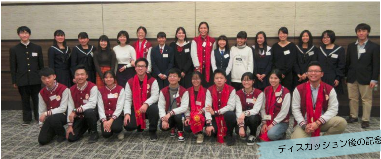
ディスカッション後の記念撮影

ハブスクール指定校生徒、広東省高校生混合で6グループに分かれ、各自の「元気の素」をテーマにディスカッションし、チームでまとめた意見を英語で発表しました。チームメイトの発言をしっかりと聞き、意見をまとめる作業ではサポートスタッフの助けを借りながらみんなで協力して課題に取り組んでいました。