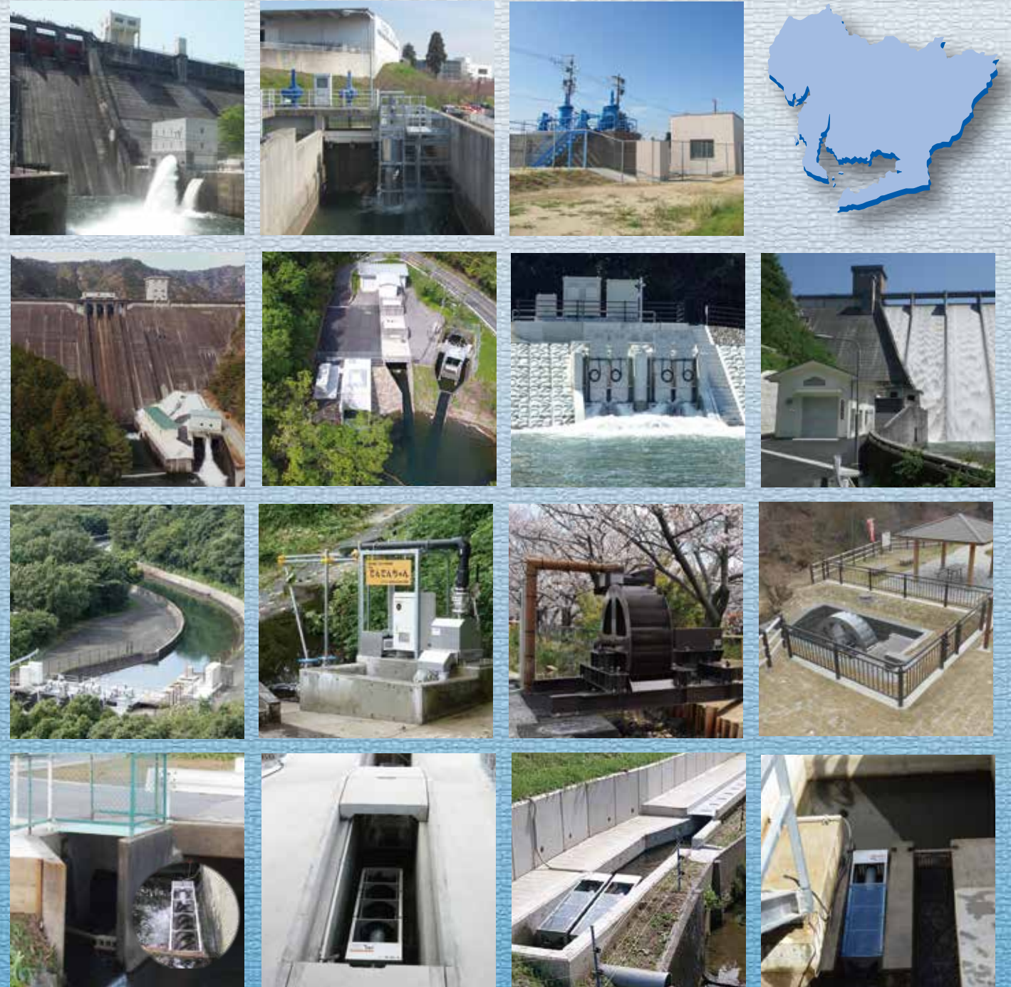
[表紙写真] 1段左より 羽布ダム(豊田市)・西尾(西尾市)・中井筋(安城市) 2段左より 宇連ダム(新城市)・駒場池流入工(豊川市)・佐布里分水口(知多市)・大島ダム(新城市) 3段左より 二川(豊橋市)・四谷(新城市)・篠目童子(安城市)・稲橋(豊田市) 4段左より 北浜川西(西尾市)・大内(蒲郡市)・敷島(豊田市)・高里第1(新城市)

愛知県農業用水小水力等発電推進協議会 愛知県 農林水産部 農林基盤局 農地計画課