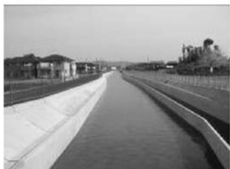
国営総合農地防災事業 新濃尾地区 (工期 H10～26)