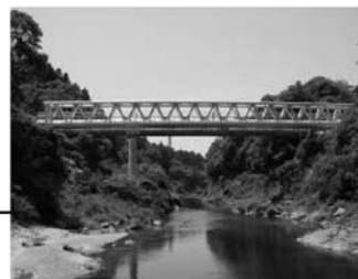
水資源機構営 豊川用水二期事業 (工期 H11～27)