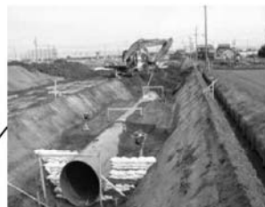
かんがい排水事業 村高地区(工期 H18～27)