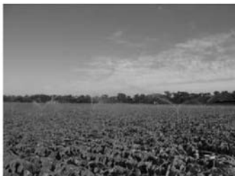
畑地帯総合整備事業 伊良湖2期地区 (工期 H21～26)