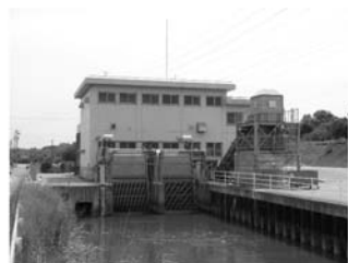
湛水防除事業 鍋田2期地区(工期 H8～27)