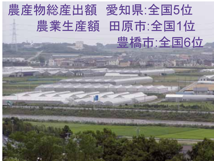
豊橋技科大 教授室からの眺め

農産物総産出額 愛知県:全国5位 農業生産額 田原市:全国1位 豊橋市:全国6位