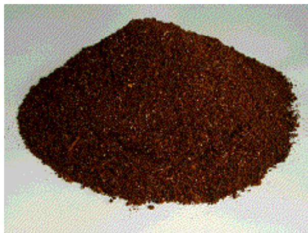
図1 リサイクル飼料