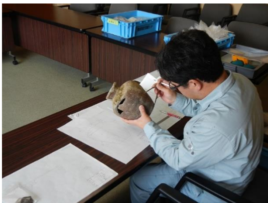
遺物実測図の作成

遺物実測・トレース図作成は、土器 103 点、木器 40 点、石器 15 点を対象として行った。遺構図は、遺跡全体図編集を 4 点、個別遺構図編集を 170 点、基本層序柱状図編集を 32 点実施した。自然科学分析は、樹種同定 35 点、放射性炭素年代測定 12 点、珪藻分析 11 点について実施した。遺物の写真撮影は個別写真・集合写真合わせて 118 点を実施した。