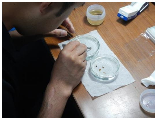
自然科学分析（サンプルの採取）