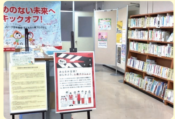
あいち人権啓発プラザ