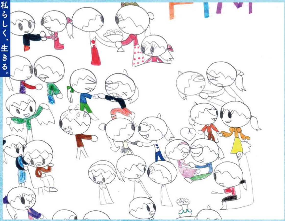
作:本田 杏葉 (私の大切なもの)