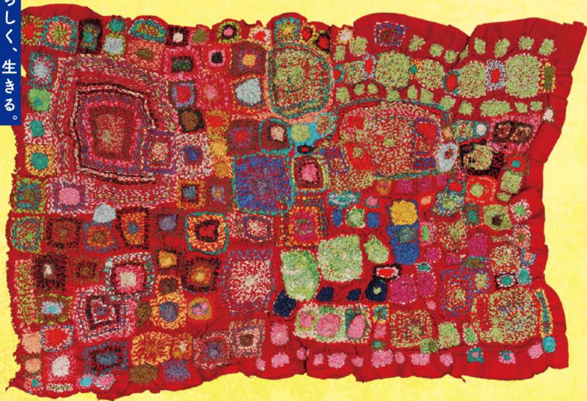
作:佐々木 早苗《無題》 撮影:大西 福夫 所蔵:日本財団