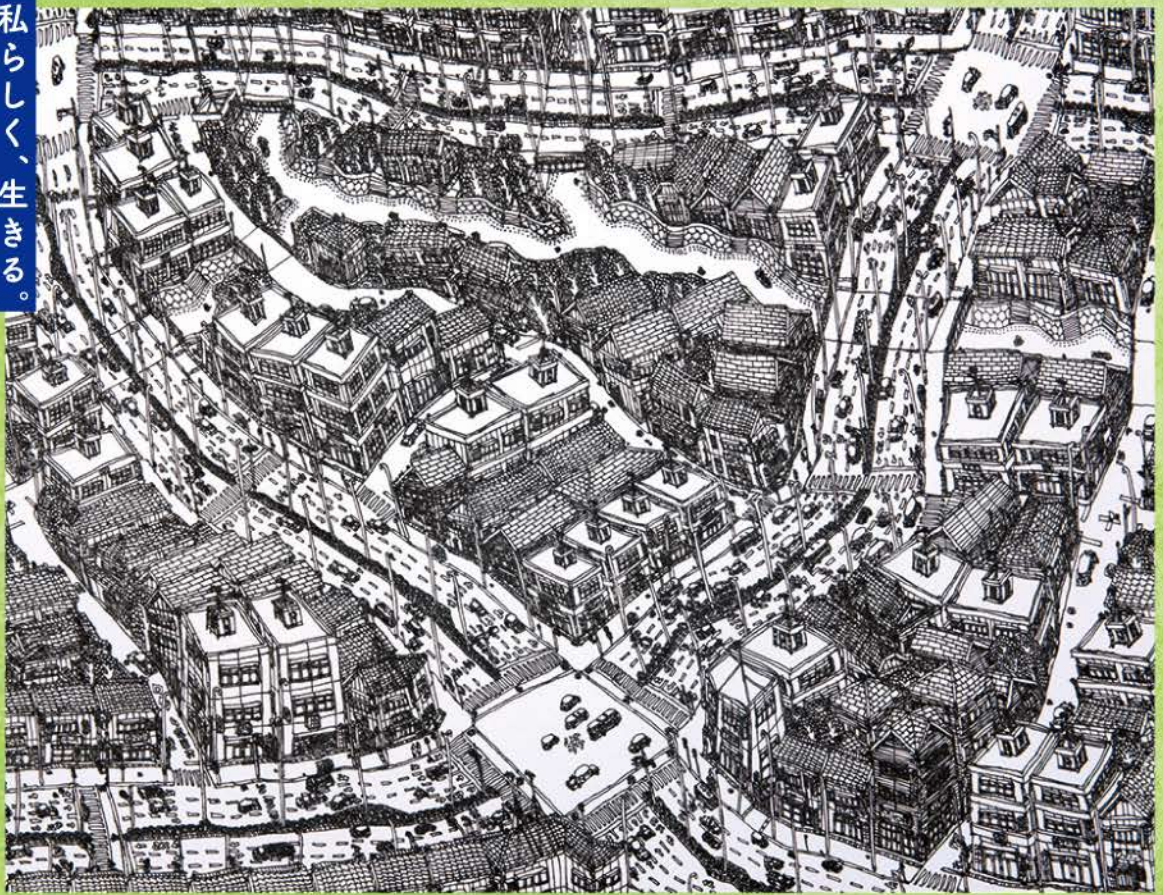
作:辻 勇二《心でのぞいた僕の街》