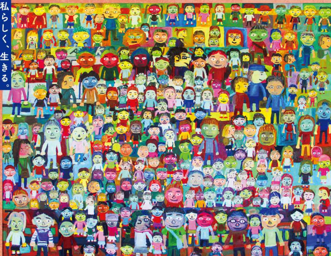
作:早川 拓馬 (あなたわたし)