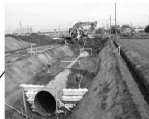
かんがい排水事業 村高地区(工期 H18～27)