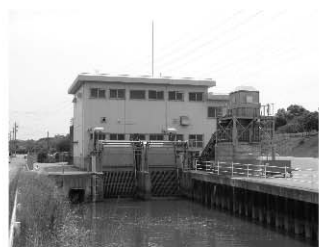
湛水防除事業 鍋田2期地区(工期 H8～27)