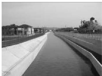
国営総合農地防災事業 新濃尾地区 (工期 H10～26)