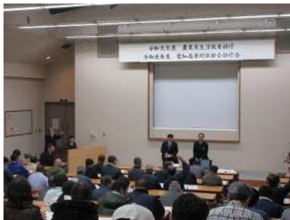
[講師2名に対して、熱心に交わされた質疑応答]

モモの急性枯死症状やナシのさび色胴枯病は古くから知られている障害で、近年発生が増加しています。これらの現状と対策についての生産高度化研修を、愛知県果樹振興会と共催により12月17日(火)に開催し、119名が参加しました。