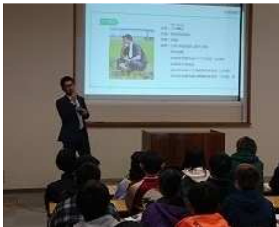
[講師の八木社長と真剣に聴講する学生たち]

また、当たり前前の農作業に対して、異業種の方は、先入観に捉われないため問題が把握でき、意見として発言したことで改善が図られた事例を用いて、「より良くするには、こう変えていこう」と言える人になってほしいとも発言されました。