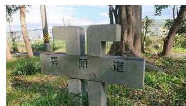
[馬頭道沿い東側にある石標]

先日、学校敷地から外部へはみ出している雑木処理のため、馬頭道を北から南へ歩いていった時でした。これまで、車からでは見落としていた道沿いにある石標に気が付きました。