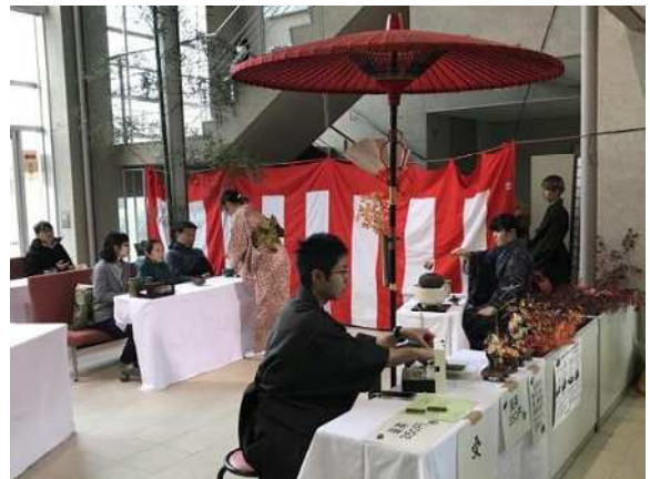
[茶道部による農大茶席]

午前・午後2回実施した農大キャンパスツアーには、合計で121名の参加者があり普段は入ることができないほ場を巡って、農大への理解を深めていただくことができたのではないのでしょうか。アンケートでも「面白かった。」「興味深かった。」といった感想を多くいただきました。