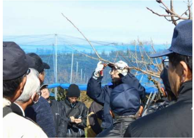
【講師の実演を熱心に見入る受講者の皆さん】

講義では、家庭果樹の苗木の選び方、剪定の方法について、イメージ図を描きながら講話いただきました。