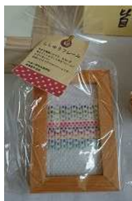
[ししゅうフレーム]

布目を慎重にかぞえ、色目を考えて刺繍した布を飾り付けた世界にひとつだけの「ししゅうフレーム」、地元のワラを使い本数を7の倍数にこだわった「みあいのしめ縄」、洗剤いらずの「アクリルたわし」(以上作業製品)や、何これ??と思わず目を引く「粘土かいじゅう」(美術作品)など、紹介しきれないほど多くの逸品、力作が勢揃いしました。どの品も生徒さんたちが一生懸命に作った様子が目に浮かぶものばかりで、来場者の皆さんも足を止めて熱心に見入る姿が見受けられました。