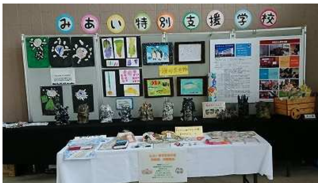
[教育棟ホールに展示された作品たち]

これまでも、特別支援学校とは児童・生徒さんたちの農大校内の見学受け入れや、鶏卵など農大生産物の訪問販売等の交流がありましたが、今回は本校からの展示依頼に対して、支援学校が快く応えていただいたことで実現しました。