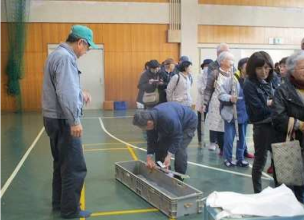
【とってもお買い得!! 農大産のジネンジョ】

今年は、例年以上の豊作で、1メートル以上のジネンジョをたくさん収穫することができました。研修生・職員とも時間を忘れて、夢中になってジネンジョの収穫を行いました。