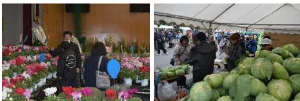
[鉢物・緑花木(左)と露地野菜(右)の販売ブース]

学生が丹精込めて育てた各専攻の農畜産物の直売ブースは毎年大変好評で、今年も体育館で販売の鉢物・緑花木専攻のシクラメンやコチョウラン等を目当てに、午前8時45分の整理券配布には、既に長い行列ができていました。また、養豚・養鶏専攻の卵や露地野菜専攻のハクサイ、キャベツ等販売ブースでも多くの方が販売時間前から