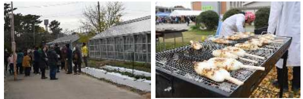
[キャンパスツアー(左)と作物専攻恒例の五平餅(左)]

また、食品バザーのブースでも、農大生手作りのうどん、五平餅、フランクフルト等を買求める方の列ができていました。