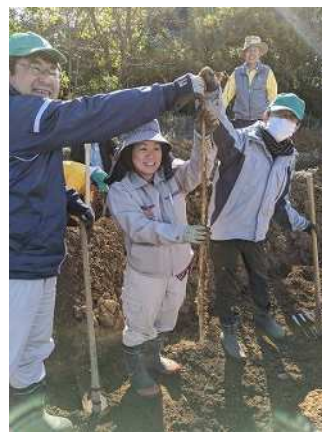
[笑顔がはじける収穫風景]

売しております。実習のひとつとして、中山間地特産野菜であるジネンジョを毎年栽培しており、何人ものジネンジョ生産者がこの研修から巣立っております。