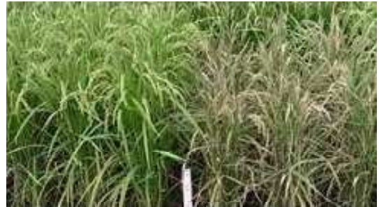
[イモチ病の発生状況 左：中部138号 右：ミネアサヒ]

ネアサヒ」として流通させる予定とのことでした。また、「ミネアサヒ」のブランドを維持するため、栽培地域の拡大は行わない、多肥栽培は行わない等の注意点についての説明がありました。