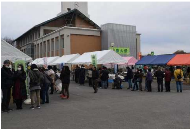
[10時前から行列が…。ありがとうございました!]

「農大祭2019」を、12月7日(土)午前10時から午後2時まで農業大学校において開催しました。この日に向けて、出荷の調整や会場準備を行ってききましたが、数日前には雨という予報もあり、学生及び職員の皆がやきもきしていました。