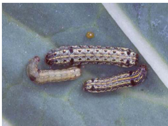
図2 ハスモンヨトウ中齢、老齢幼虫