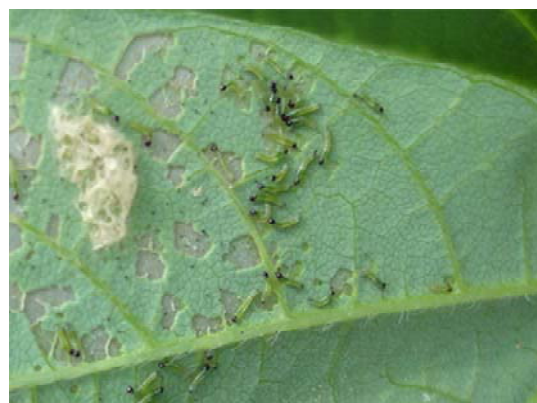
図3 分散前のハスモンヨトウ若齢幼虫