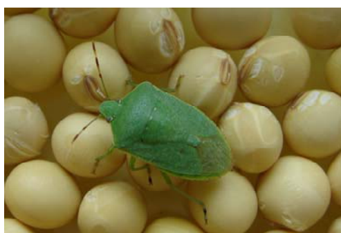
図1 ミナミアオカメムシ成虫

9月下旬の巡回調査の結果、ミナミアオカメムシ（図1）やアオクサカメムシなどの吸実性カメムシ類の100株あたりの寄生虫数は13.7頭（平年0.7頭）となり、平年を大きく上回り、過去10年で最も多くなっています（図2）。特に、昨年新たに発生を確認したミナミアオカメムシが、本年8月時点で県内16市町のほ場で確認されており、生息域が急速に拡大しています。また、9月25日発表の1か月予報では、気温が高い確率が50%と予想されており、今後の発生に好適な条件が続くと思われるため警戒が必要です。