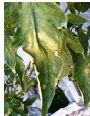
↑ 葉が褐色に変色し乾燥 して焼けたような症状