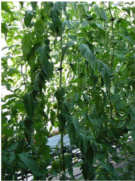
←萎凋症状 葉が青いまましおれている