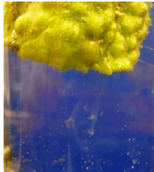
↑ 茎を切って水につけると わずかに白濁液を噴出 することがある (青枯病は大量に噴出)