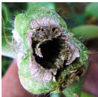
↑ 導管が淡褐色に変色 中心の柔組織が消失し空洞