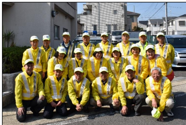
北一社セーフティ・パトロール隊