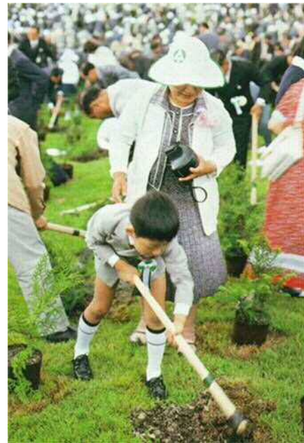
一般招待者の植樹の状況