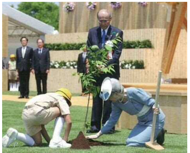
天皇皇后両陛下お手植えの状況