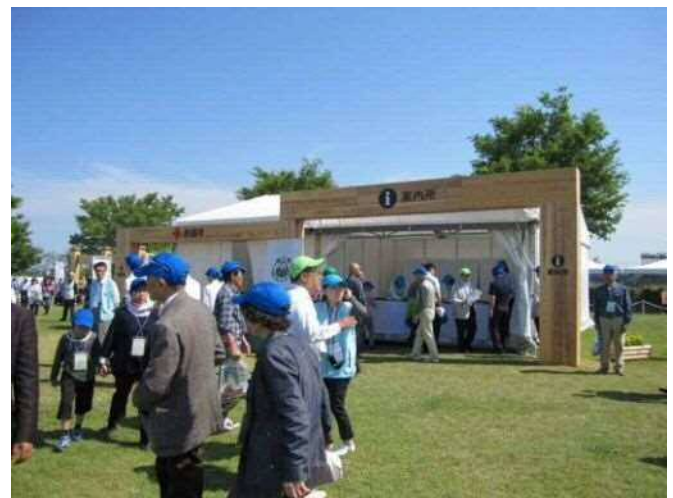
おもてなし広場の状況