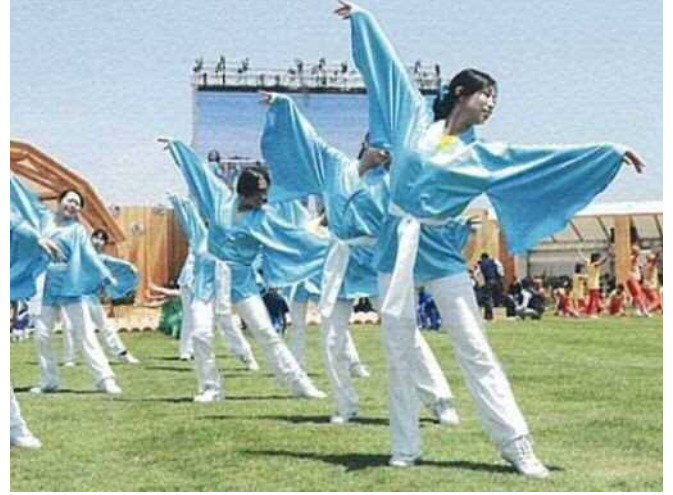
アトラクションの状況