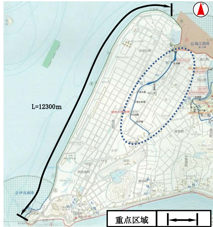
図3 田原市渥美地区付近図