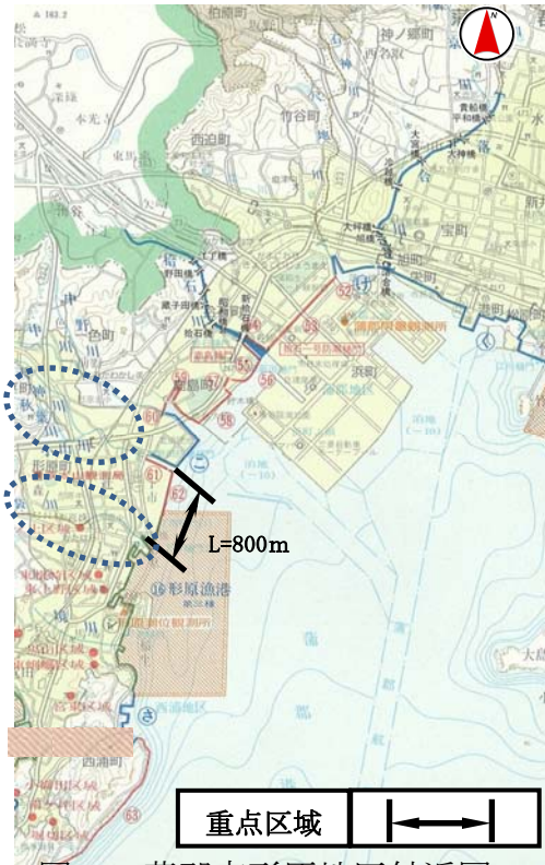
図2 蒲郡市形原地区付近図