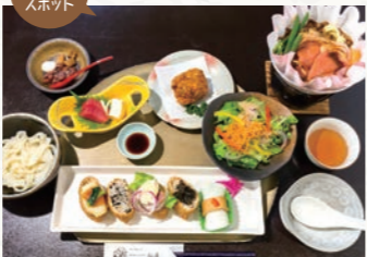
創作豊川いなり寿司

豊川稲荷表参道 お土産屋さんや、飲食店が立ち並び楽しい参道です。道中には豊川いなり寿司や厚揚げなど立ち寄りグルメもたくさん!