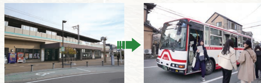
蒲郡駅 竹島遊園バス停 蒲郡駅南口より名鉄バス蒲郡市民病院行き(左回り)へ。日中1時間に1本程度運行。又は徒歩(15分程度)。

三河の逸膳 松屋 豊川稲荷の総門前にある四代続く老舗の和食処。創作豊川いなり寿司や地元のお料理が盛りだくさん。 豊川市門前町5 散策自由 (昼) 11:00~14:30 (夜) 17:00~22:00 夜は完全予約制