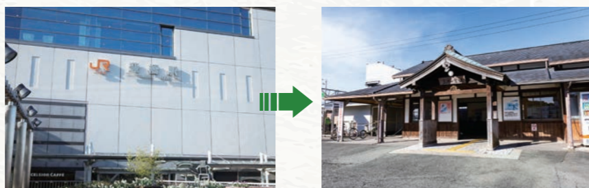
豊橋駅 三河一宮駅 豊橋駅より、JR飯田線へ。日中は概ね30分~60分間隔で運行。