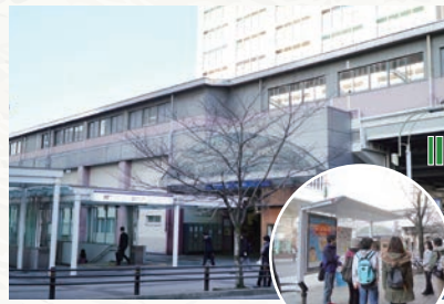
藤が丘駅ターミナル