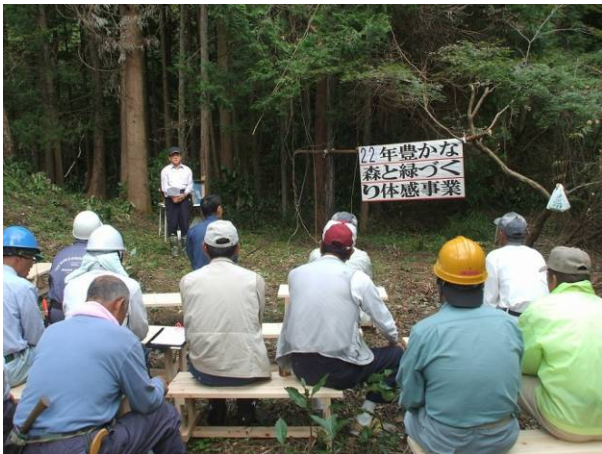
森林文化の体験・学習 (豊田市)