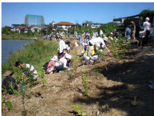
県民参加による植栽 (大府市)