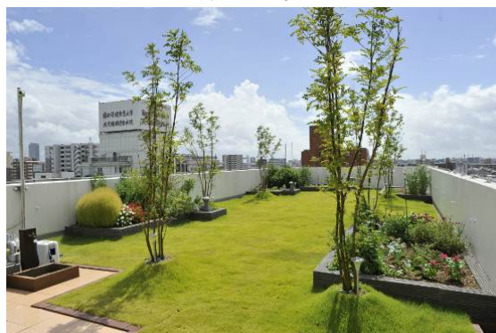
屋上緑化 (名古屋市)