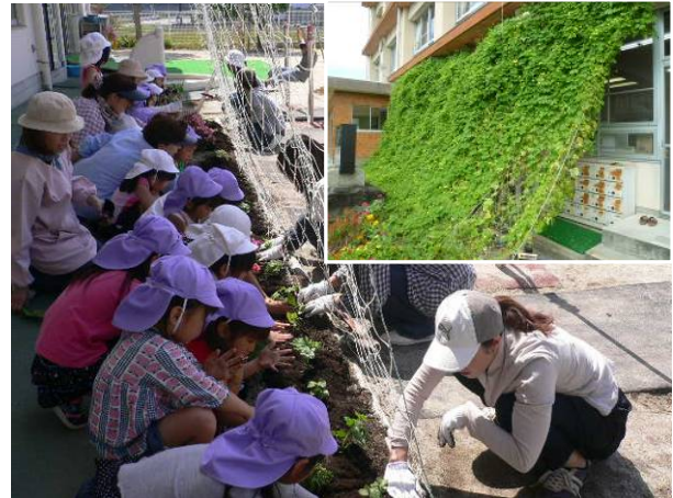
太陽・自然の恵み学習 (西尾市)