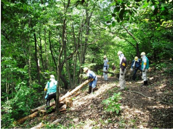
森・緑の育成活動 (日進市)