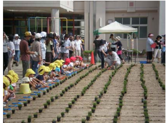
県民参加による園庭芝生化 (みよし市)