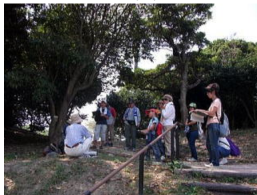
森づくり講座 (知多市)