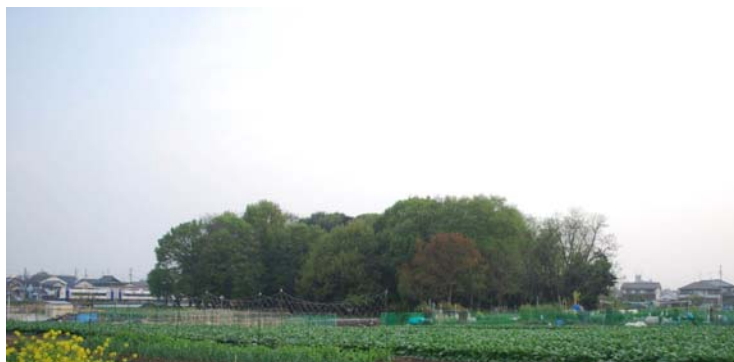
用地買収による緑地の保全 (扶桑町)