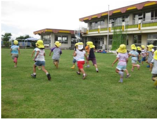
保育園の園庭芝生化 (一宮市)