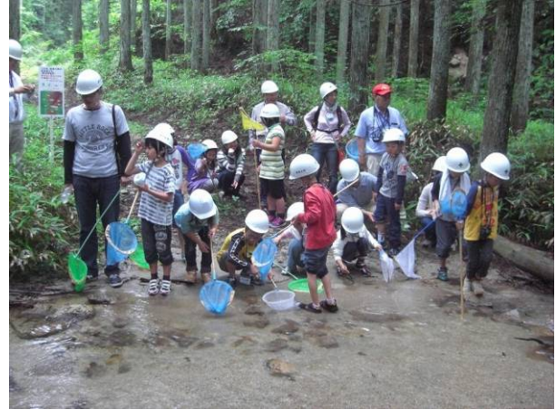
水と緑の恵み体験 (瀬戸市)