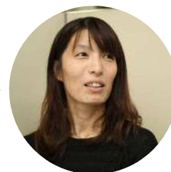
設計職 女性スタッフ 様

設計担当ということもありパソコンがあればどこでも作業ができるので、育児のため出社が難しい時期にこちらから社長に相談して在宅勤務となりました。もともと学生時代にも設計のアルバイトをしていたので家で作業をすることに慣れていたのもあり、育児のため専業主婦となって会社を辞めたくないと思っていたわたしには非常に良い環境だと思っています。「育児」と「業務」の両立を求めている女性は多いと思います。