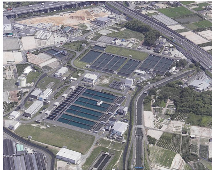
上野浄水場 (平成30年8月撮影)