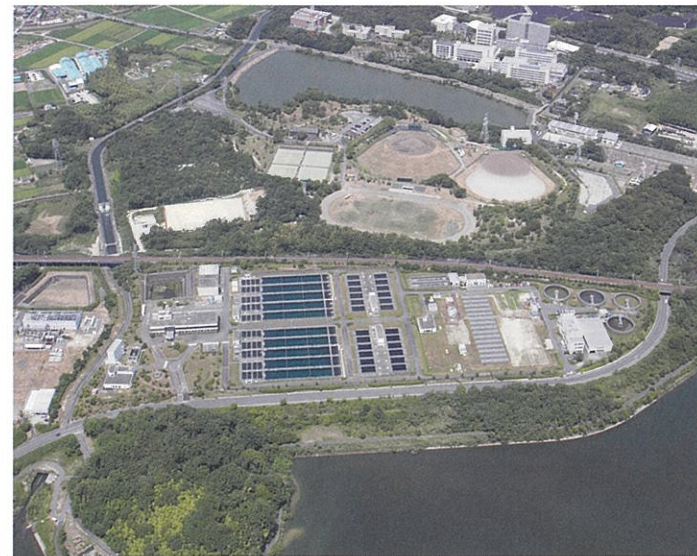
尾張東部浄水場 (平成30年8月撮影)

その後、昭和37年度～40年度の第1期拡張事業、昭和40年度～46年度の第2期拡張事業及び昭和47年度～55年度の第3期拡張事業により、1日給水能力は499千m 3 となりました。