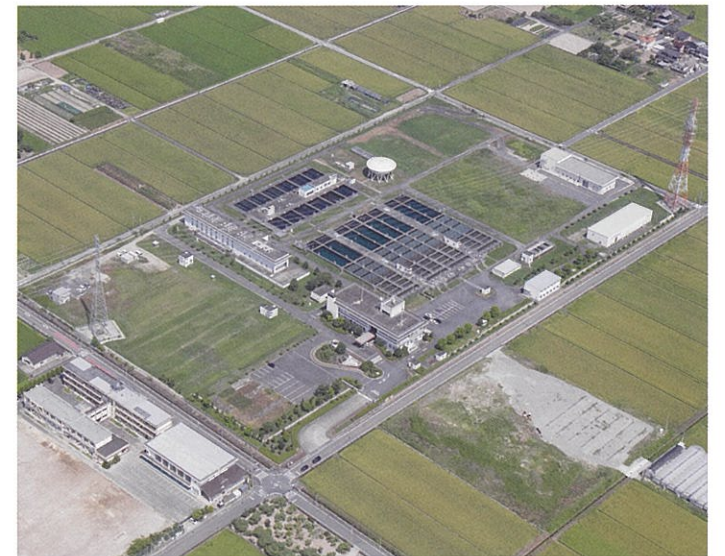
尾張西部浄水場 (平成30年8月撮影)

昭和60年度には尾張西部浄水場の給水を開始し、現在では岩屋ダムを水源として1日の給水能力は、約513千m 3 となりました。今後も施設整備を引き続き行い、完成時には、約636千m 3 となる予定です。