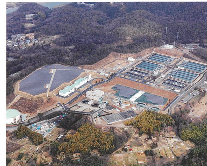
犬山浄水場 (平成29年1月撮影)