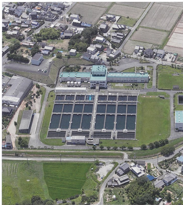
幸田浄水場（平成30年8月撮影）