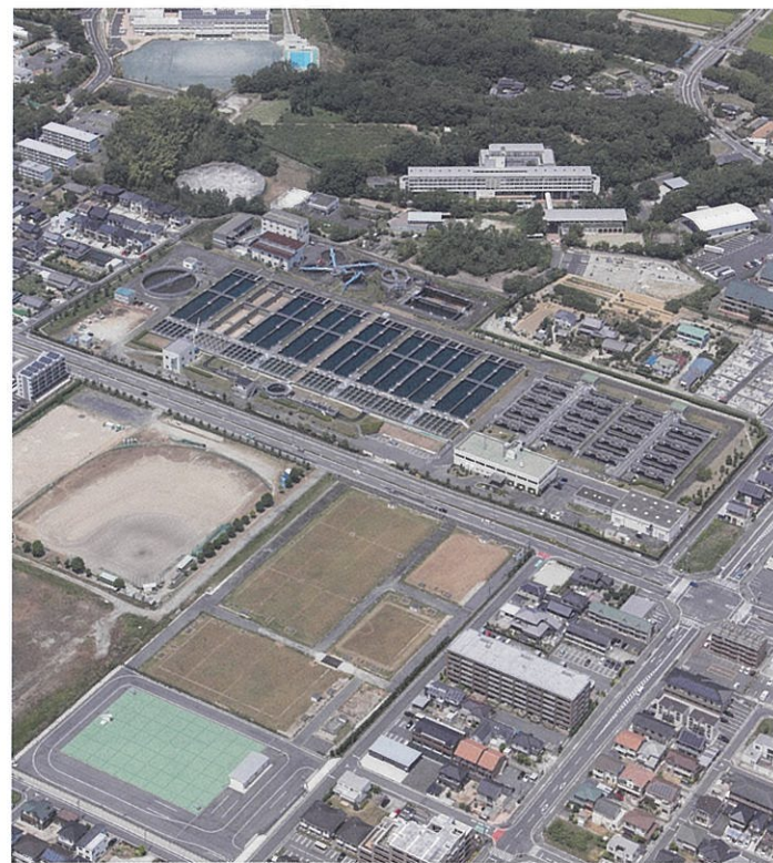
豊田浄水場（平成30年8月撮影）