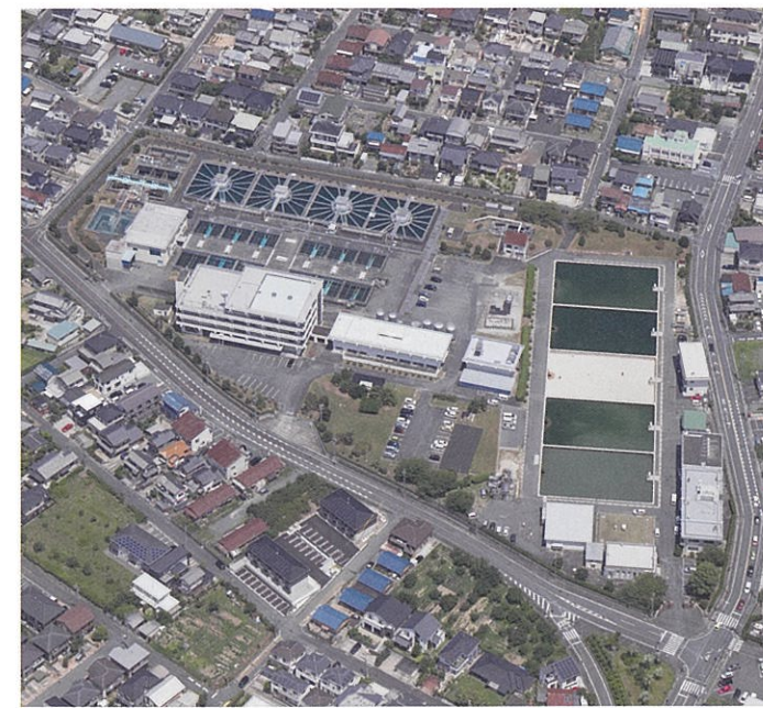
豊橋浄水場（平成30年8月撮影）

東三河地域では、増大する水道用水の需要に対処するため、豊橋市はじめ3市2町が豊川用水事業に参加して、それぞれ独自の水道事業計画を立て実施してきました。しかし、豊川用水事業費の増大に伴う市町営水道事業経営への大きな影響などにより、県営移管が強く要望されました。他方、豊川用水事業に参加していなかった新城市、一宮町（現在の豊川市）からも県営による水道用水供給事業からの給水を要望されまし