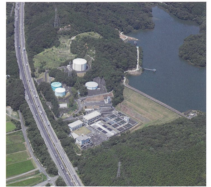
豊川浄水場と駒場池（平成30年8月撮影）

現在では、宇連ダム、大島ダム等を水源として1日給水能力は約267千m 3 となりました。今後も施設整備を引き続き行い、完成時には約278千m 3 とする予定です。