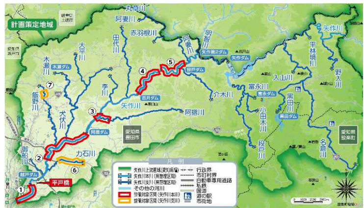
②枝下大橋～阿摺ダム下流区間の整備イメージ