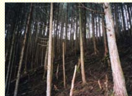
間伐が必要な人工林

都市の緑については、公園や街路樹など公共施設における緑の量は増えていますが、市街地の多くを占める民有地の緑が減少しています。