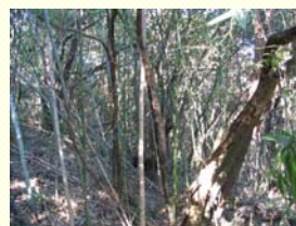
放置された里山林