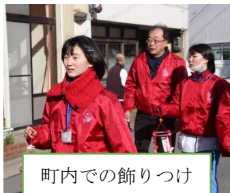
町内での飾りつけ