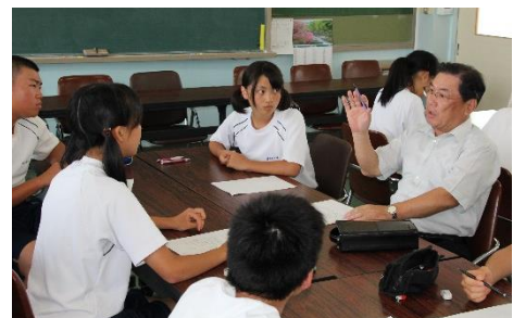
校区会長と会議を行う生徒

この会議は各市民館長やPTA役員と生徒との会議のことであり、本校独自のネーミングである。主にサンキュー☆福江や資源回収（クリーン作戦）などでこの会議を活用している。この会議が始まってからは市民館との関係が深まり、市民館祭りへの協力やや揭示物の作製などの要請が増えている。