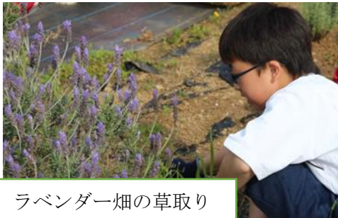
ラベンダー畑の草取り

ラベンダー栽培をもとにラベンダーウォーターを抽出し、関連製品を製作販売し、地域活性化に寄与する活動。渥美半島ハーブの会との共同企画で5年前から始まっている。活動の中心はドリームの会であるが、草取り等は全校体制で行い、3年前から本校園芸部との共同活動となっている。主に、販売活動を担っている。