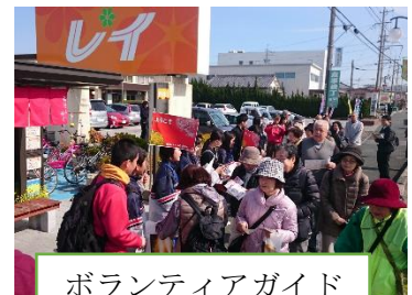
ボランティアガイド