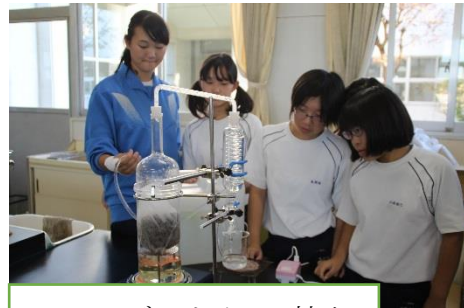
ラベンダーオイルの抽出