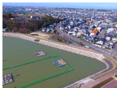
ため池の耐震対策