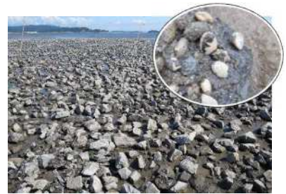
貝類増殖場と碎石に付着したアサリ