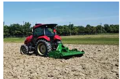
オートトラクタの実証