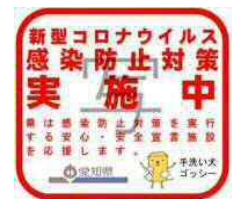
PRステッカーの見本