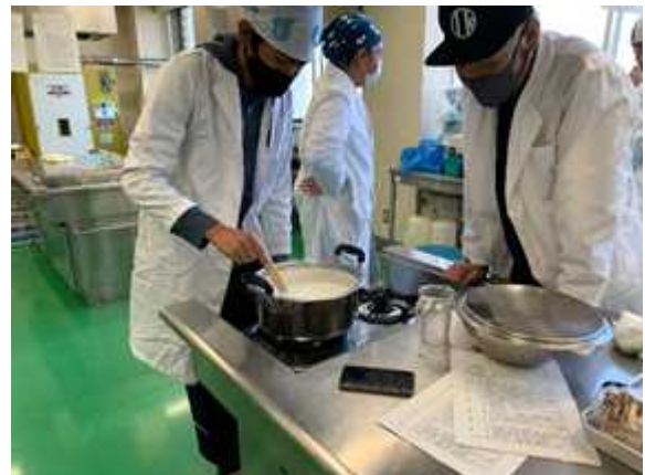
[豆腐を作っている様子]

味噌作りでは、大豆を圧力鍋で煮た後、タライの中に入れてつぶし、それに米麴と豆麴、天塩を混ぜたものをボール状にして殺菌した容器に隙間ができないように投げ込んでいきました。そして、冷暗所に1年間保存します。仕込んだ味噌は翌年度の農大祭で五平餅用の味噌作りに使用しています。1年後どのような味噌になっているか楽しみです。