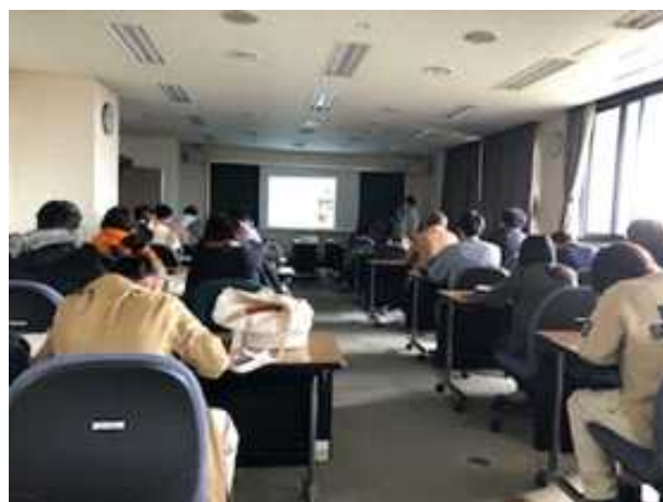
[農業総合試験場での講義]

農業総合試験場は、家畜防疫の観点から研究所内の見学はできませんでしたが、試験場の役割や業務概要、養牛研究室及び養豚研究室における研究内容について、また、家畜防疫体制について詳しく講義をしていただきました。少し専門的で難しい箇所もありましたが、試験場で研究されている色々な研究内容に興味を持って学ぶことができました。防疫については、同じように家畜を扱う仕事に携わる点から、その重要性をしっかりと理解して、厳重に管理されている施設を見学できなかったことを残念に思う一方、「徹底している防疫体制に自分たちの日頃の家畜飼養衛生管理に対する甘さ、今後の対策の必要性」について学ぶことができました。