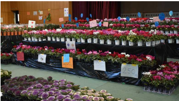
[専攻販売 (鉢物・緑花木)]

その結果、食品バザー等の飲食を伴う催事は、実施できませんでしたが、農産物の販売を中心に開催することができました。