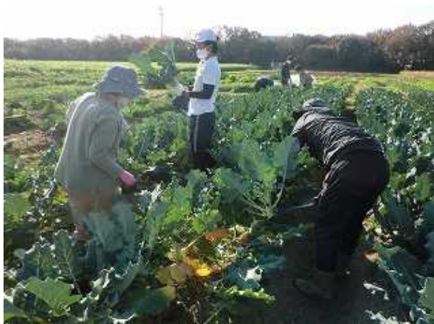
[収穫作業を学ぶ様子]

12月7日(月)に農福連携支援研修の閉講式を実施し、研修生17名が修了しました。農福連携支援研修は、福祉事業所職員が施設の栽培ほ場で運営するために必要な基礎知識や技術を修得することを目的として実施しました。また、農家へ出向く施設外就労に向けて、農作業を行う作業員への確に作業方法が伝えられる手法を身につけるよう、農業の実際と指導方法について学びました。研修期間は6月22日(月)から12月7日(月)までで、講義と実習を14日間、視察研修会を1回行いました。