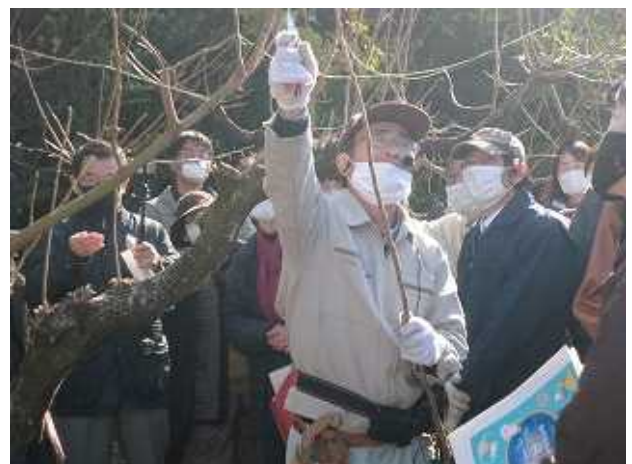
[剪定のポイントを説明する講師]

模範実技では、カキを中心に、講義で説明した剪定ポイントを実演しながら復習しました。残す枝の決め方、剪定のコツなどをウメの剪定でも実施し、丁寧に御指導いただきました。