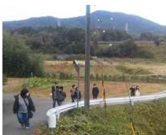
[視察ほ場への移動風景]

また、豊橋市石巻地区の柿農家では、学生を引率していただいたバスの運転手さんの意外な一面が学生を驚かせました。待ち時間、やさしい柿農家から柿とナイフを渡された運転手さんがプロ顔負けのナイフ捌きを披露。以前は調理師で果物好きなんだとか。柿農家の語る産地と若手への熱い思いを聞きつつ、販路の先の人に思いをはせる貴重な時間となりました。