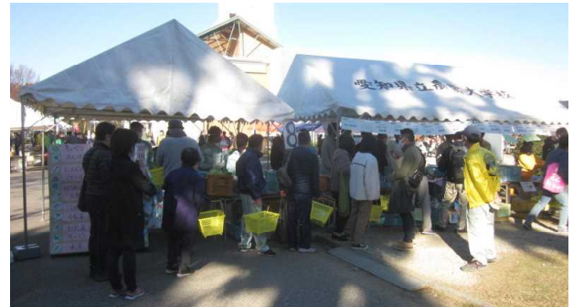
[専攻販売 (露地野菜)]

テントブースでも、養豚・養鶏専攻の卵や露地野菜専攻のハクサイ、キャベツ、作物専攻の米等を買求める姿が見られ、ソーシャルディスタンスの確保に努めながら販売を行いました。また、例年にはないわら細工やリースなど農大生手作りの商品も並びました。