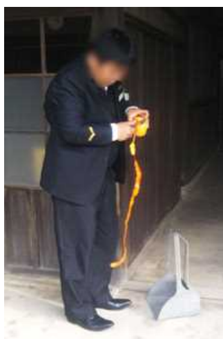
[運転手さんにも園主さんからお裾分け、まさかの元調理師さん、、、]

農大には柑橘類がハウスの宮川早生（温州）と露地の柚しかなく、学生はほ場見学や研究員からの説明、試食に目を輝かせていました。特に試食に出された「夕焼け姫（愛知柑橘1号）」「みはや」へは食いつきが良く、柑橘栽培のおもしろさと奥深さを満喫したようです。帰り際、本校職員を先頭に『おみやげ(食味調査用)』の確保にも余念がありません、、、大変おいしゅうございました。