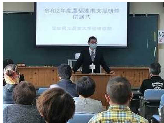
[閉講式での校長の式辞]

く聞かれ、野菜栽培の基礎を実習、講義で学べたことは良かったとの意見も多く出されました。