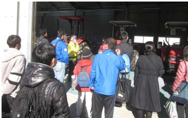
[キャンパスツアー]

9時30分と11時の2回実施した農大キャンパスツアーには、合わせて51名の参加者があり普段は見えていただけない圃場やトラクター等を見学して、農業や農大への理解を深めていただくことができたのではないのでしょうか。