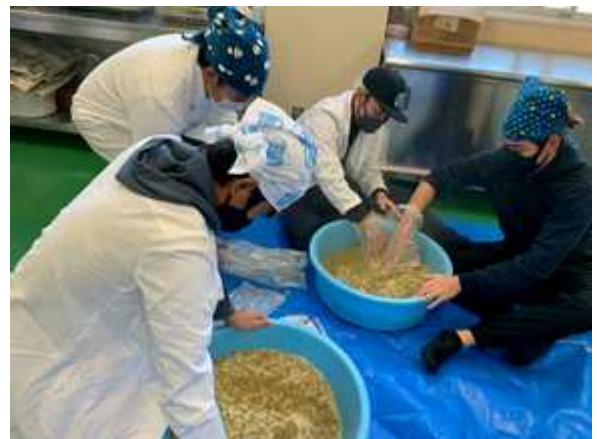
[味噌作りに挑戦する学生の様子]

味噌作りでは、大豆を圧力鍋で煮た後、タライの中に入れてつぶし、それに米麴と豆麴、天塩を混ぜたものをボール状にして殺菌した容器に隙間ができないように投げ込んでいきました。そして、冷暗所に1年間保存します。仕込んだ味噌は翌年度の農大祭で五平餅用の味噌作りに使用しています。1年後どのような味噌になっているか楽しみです。