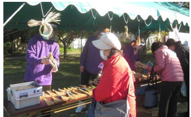
[専攻販売 (わら細工)]

後援会のブースでは、学生の保護者が収穫した野菜や花、果物、豚肉などを、隣のブースでは、協賛団体提供のお菓子やしい