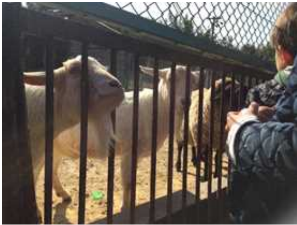
[ヤギとの触れ合い]

用温室や畜舎で生産しています。飼養頭数規模は農大よりも少ないですが、展示も意識した畜舎の他に、牛乳やジェラートの乳加工施設、ヒヨコをかえすためのふ卵施設があり、学生たちは普段の実習では目にすることがない施設・設備や鶏の品種展示を熱心に見学していました。また、ホルスタイン種の子牛も数頭生まれていて、農大で普段から見慣れている学生でも、やはり子牛はどこでもかわいいようで、歓声を上げながら触れ合う姿が印象的でした。