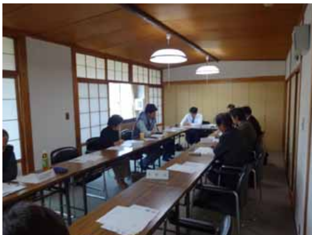
集落支援員意見交換会の様子

都市住民が集落活動を支援する仕組みとして、三河山間地域4集落（岡崎市下山地区、豊田市梅崎町、豊田市上中町、設楽町沖駒地区）において「三河の山里 - 草刈応援隊」事業を実施