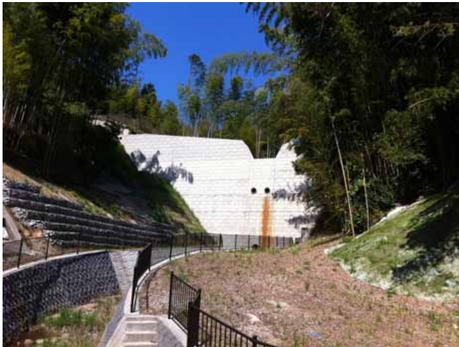
新たに整備された堰堤（矢作川水系：豊田市足助町）