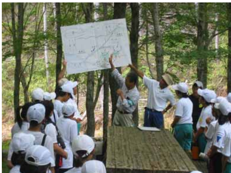
北設楽地区における連携型中高一貫教育のサマーセミナーでの様子 （高校生と中学生と一緒に演習林内の植生について講義を聴き、地域の環境について学んでいる。）

北設楽地区においては、田口高等学校と設楽中学校・津具中学校・豊根中学校の3中学校との間で、作手地区においては、新城東高等学校作手校舎と作手中中学校との間で、連携型中高一貫教育を推進