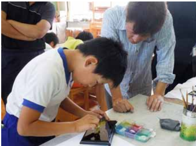
蒔絵師に学ぶ体験 (旧 新城市菅守小学校)