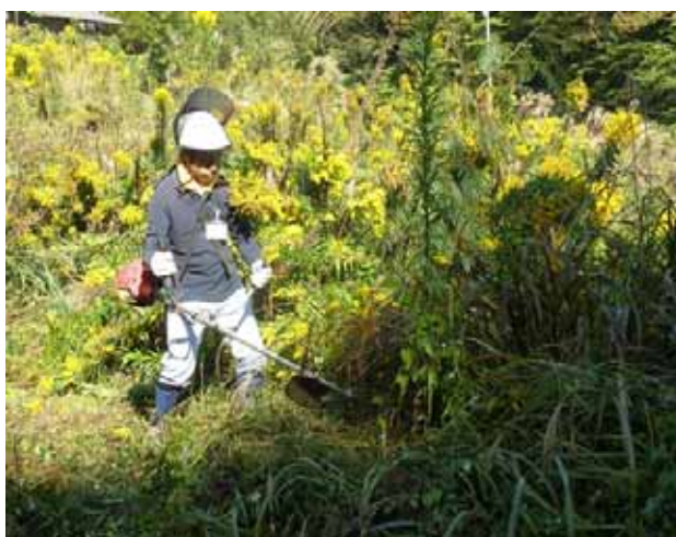
「三河の山里 - 草刈応援隊」活動

都市住民が集落活動を支援する仕組みとして、三河山間地域4集落（岡崎市下山地区、豊田市梅崎町、豊田市上中町、設楽町沖駒地区）において「三河の山里 - 草刈応援隊」事業を実施