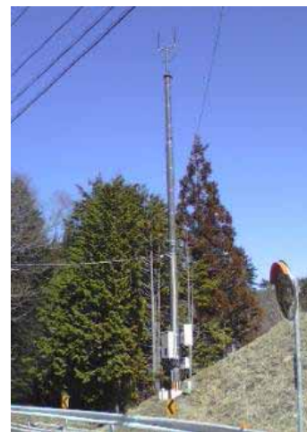
新設された携帯電話基地局 (豊根村明金地区)

農業分野におけるIT化の強化を図るため、農業大学校において農業者に対するパソコン研修を実施