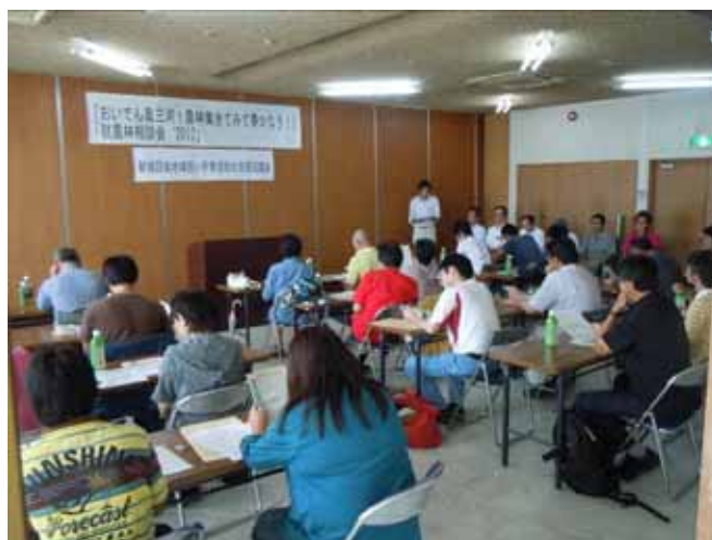
就農相談会の様子(新城市)