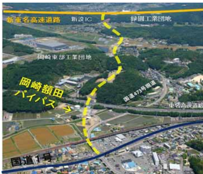
岡崎額田バイパス

立地企業に対する優遇措置として、産業空洞化対策減税基金を原資とした補助制度の運用と、産業立地促進税制の延長・拡充