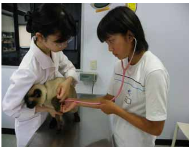
動物病院での職場体験学習 (設楽町立津具中学校)