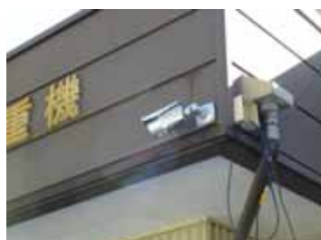
防犯カメラ設置 (豊根村)