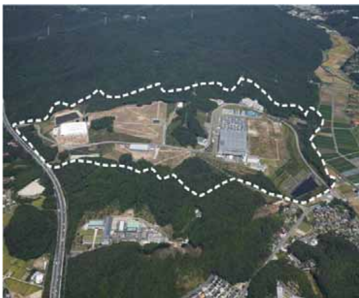
岡崎東部工業団地