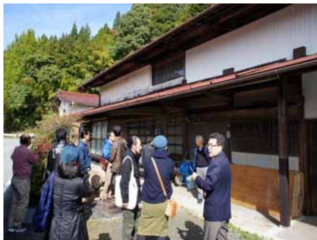
空き家リフォーム住宅見学会(東栄町)

県交流居住センターと地元自治体等との連携による「空き家リフォーム住宅見学会」を実施