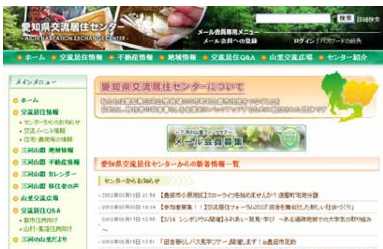
愛知県交流居住センターのホームページ

県交流居住センターのホームページを通じて、交流イベント情報、住宅情報、農地情報、就労情報、観光情報、特産品情報など都市住民のニーズに合った情報を発信