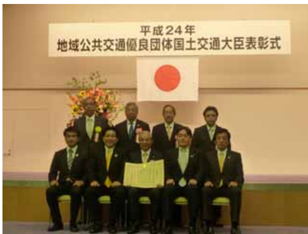
地域公共交通優良団体国土交通大臣表彰式