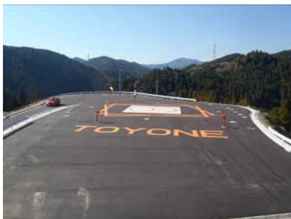
救急搬送ヘリポート整備工事完了(豊根村)